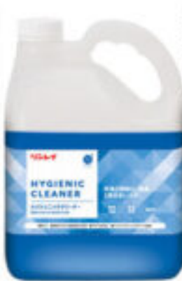
ハイジエック クリーナー-4ℓ