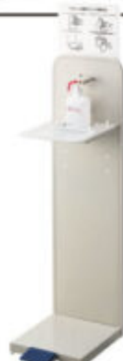
アルコール噴霧器F

ありますが、ディスプレイセンサーだけではあまり目立たず、素通りされてしまうケースがあります。弊社のアルコール噴霧器を設置した場合ですと一目でアルコール消毒スペースであるとの認識が容易になりますので、お客様でのアルコール消毒の頻度が高まります。またディスプレイセンサーに直接手を触れたくないという方、荷物を持っていて手でフッシュしづらいという方も多くいらっしゃるかと思います。それに対してこちらの商品にはペダル式であるため手を触れず衛生的かつ手間なく消毒が可能となります。以上の理由から現在数多くの問合せを頂いており好評です。現在生産体制を強化し増産しておりますのでご検討のほど何卒よろしくお願い致します。