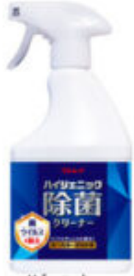
ハイジエック 除菌クリーナー-450ml